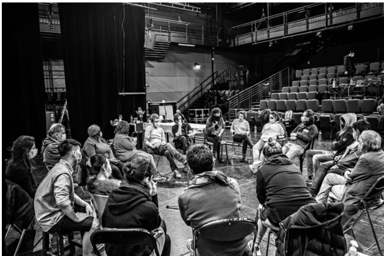
Répétitions au Théâtre National de Bretagne, janvier 2021