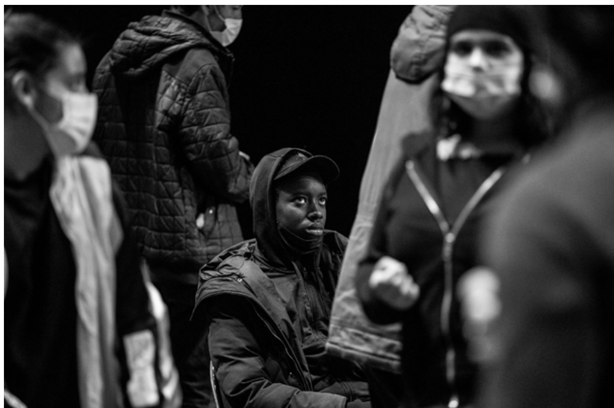
Répétitions au Théâtre National de Bretagne, janvier 2021