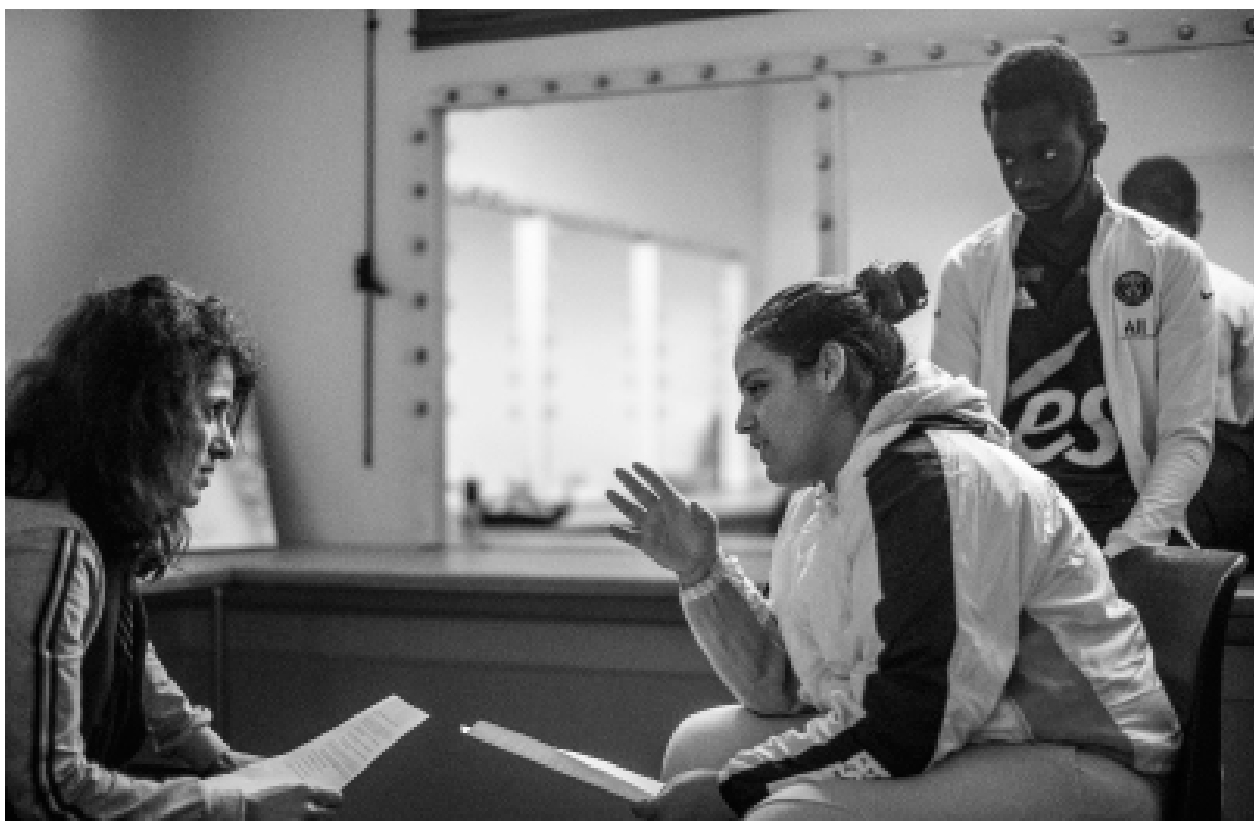
Répétitions au Théâtre National de Bretagne, janvier 2021