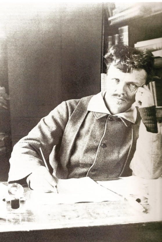
Autoportrait dans son bureau à Gersau, 1886

Dans vingt-sept de ces autoportraits, le personnage est l'écrivain lui-même. Pour lui, l'intérêt est le modèle et le photographe ne représente qu'un attrait secondaire. Les photos cherchent à reproduire une réalité non déguisée mais mise en scène. Il apparaît dans une série de rôles non empruntés à sa propre vie, dont le plus important est celui d'écrivain, puis celui de père de famille. Sur plusieurs clichés, on voit l'auteur travailler, assis à son bureau. Les images diffèrent avant tout par la pose du modèle. Il est à noter que l'expression de son visage reste toujours la même : sérieux, et même tendu, il fixe l'objectif.