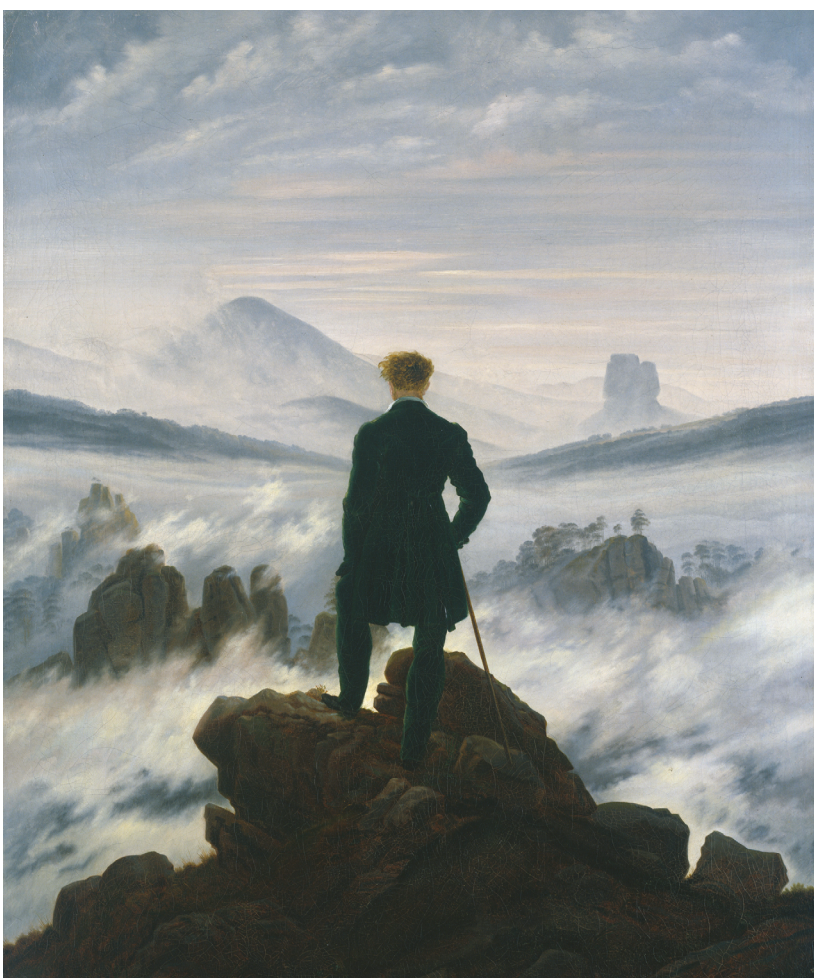
Friedrich Caspar David [1774-1840] Le Voyageur au-dessus de la mer de nuages Allemagne, Hambourg, Kunsthalle

Demander aux élèves de rechercher sur Internet (exemples ci-dessous) une image relative à leur conception de l'exil et à leur représentation de l'exilé et de justifier leur choix.