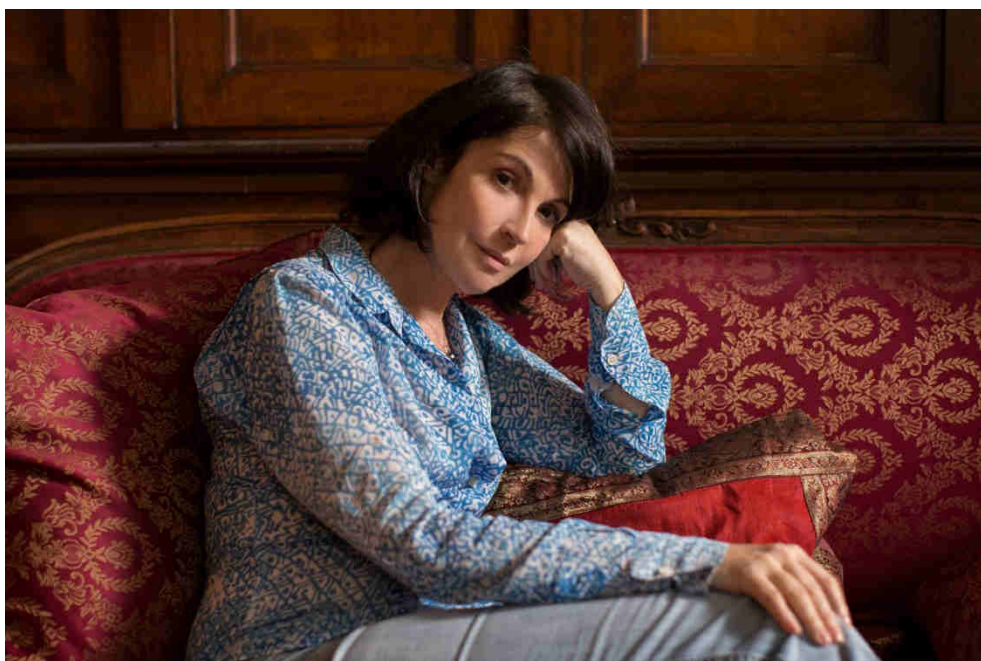
Zabou Breitman