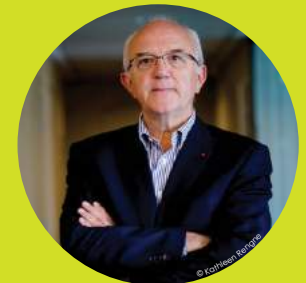
Hugues SIBILLE Président de la Fondation Crédit Coopératif