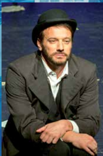
Samuel Le Bihan

Nous allons reproduire ce schéma à Paris et en tournée. Tous les soirs un invité viendra rejoindre l'équipe pris dans cette liste initiale ou sur une liste complémentaire où figureront François Berléand, François-Xavier Demaison, Zabou Breitman et bien d'autres. Ces derniers interviendront en fonction de leurs disponibilités et de leur possibilité.