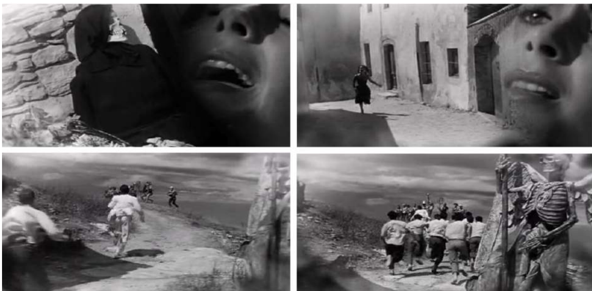
Soudain l'été dernier , Joseph L. Mankiewicz

Dans Never, Never, Never , on parle poésie et on fait tourner les tables. Mais on brode, on se rase, on parle tourtes au poulet et on boit du sherry. Le surnaturel côtoie le trivial. La pièce se déroule dans une sorte de quotidien décalé , où des objets banals se chargent d'une valeur onirique. Ils sont le trait d'union entre vivants et morts, sommeil et veille, réel et imaginaire, passé et présent. Les objets dont nous parlons se trouvent précisément dans le nœud de Möbius que constitue l'œuvre et la vie d'un poète. L'œuvre d'un poète, c'est la vie d'un poète, et vice versa , dit le personnage joué par Katharine Hepburn dans Soudain l'été dernier , film qui hante la pièce en filigrane.