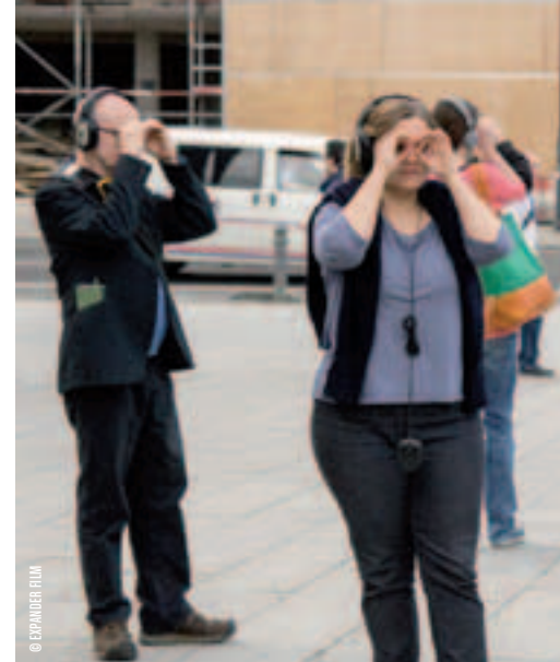
REMOTE LE HAVRE RIMINI PROTOKOLL (KAEGI /KARREBAUER)