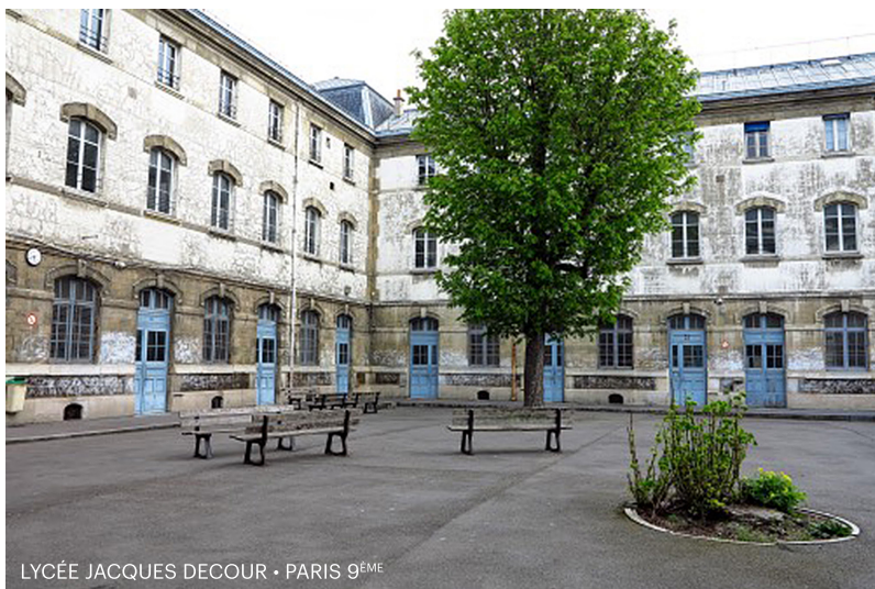
LYCÉE JACQUES DECOUR • PARIS 9 ÈME