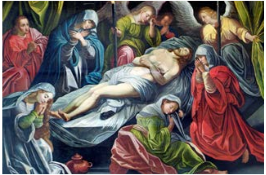
La lamentation autour du corps du Christ, Peintre anonyme, Musée de l'Hôpital Notre-Dame à la Rose, Lessines

Voici ce qu'écrivait Baudelaire à propos de Gustave Flaubert et de Madame Bovary : « Madame Bovary, - une gageure, une vraie gageure, un pari, comme toutes les œuvres d'art, - était créée ». Il avait fallu à l'auteur, pour incarner, décrire et faire vivre un personnage féminin de l'intérieur, « se dépouiller (autant que possible) de son sexe » et « se faire femme ». Ce qu'il n'avait réussi qu'à moitié : « Il en est résulté une merveille ; c'est que, malgré tout son zèle de comédien, il n'a pas pu ne pas infuser un sang viril dans les veines de sa créature, et que madame Bovary, pour ce qu'il y a en elle de plus énergique et de plus ambitieux, et aussi de plus rêveur, madame Bovary est restée un homme ». L'auteur androgyne aura ainsi créé une créature elle aussi androgyne, « comme la Pallas armée, sortie du cerveau de Zeus, ce bizarre androgyne a gardé toutes les séductions d'une âme virile dans un charmant corps féminin. »