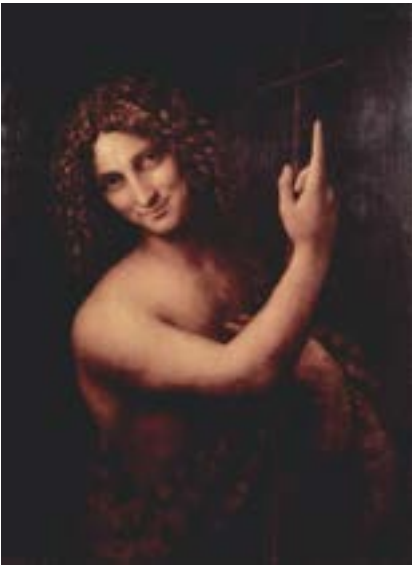
Saint Jean Baptiste, Léonard de Vinci, Musée du Louvre, Paris