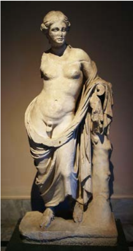
Statue d'Hermaphrodite de style hellénistique