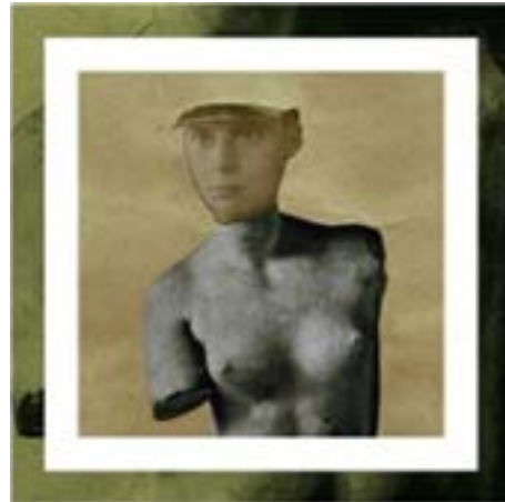
Illustration de l'ouvrage Herculine Barbin dite Alexina B. , Michel Foucault, éditions Tel Galimard