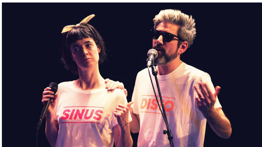
Sinus & Disto, Théâtre Am Stram Gram 2019