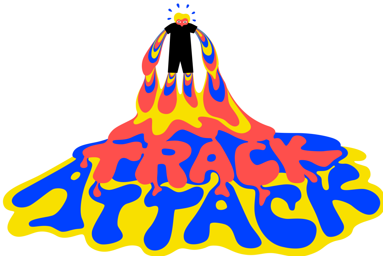
Illustration: Pauline Kerleroux