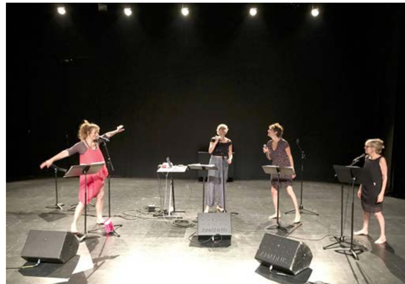
Le Parrain IV - Opér'Art Brut