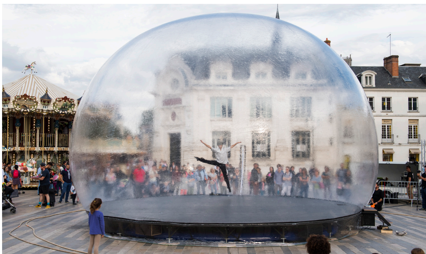
La Bulle-Environnement 2018