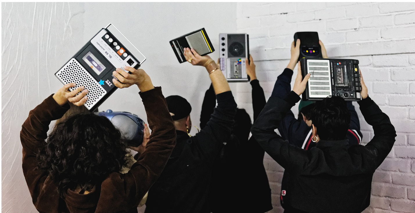
Tape Ensemble

Des musiques qui ont du style ! Clément Vercelletto ne prend pas le mot d'ordre des Subs-Sessions à la légère avec cette soirée dont il est le maître d'œuvre. Au programme : symphonie intimiste pour bandes magnétiques, transe krautrock et synthèse mutante.