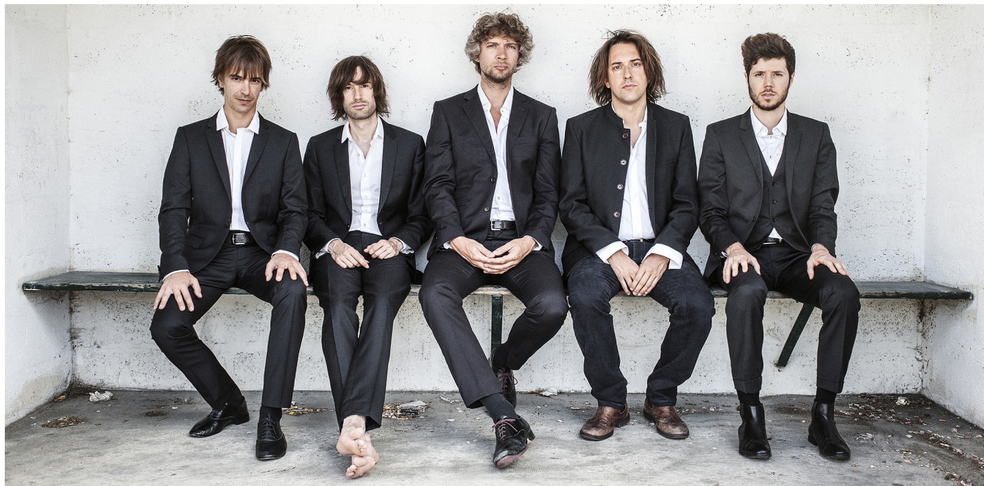
Cabaret Contemporain

UNE SÉRIE DE CONCERTS ALLONGÉS SOUS LA VERRIÈRE PARTIE 2