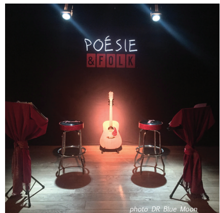
Blue Moon

HORAIRES | JEU. 20 H 30 | VEN. 20 H 30 | SAM. 20 H 30 | DIM. 16 H 00