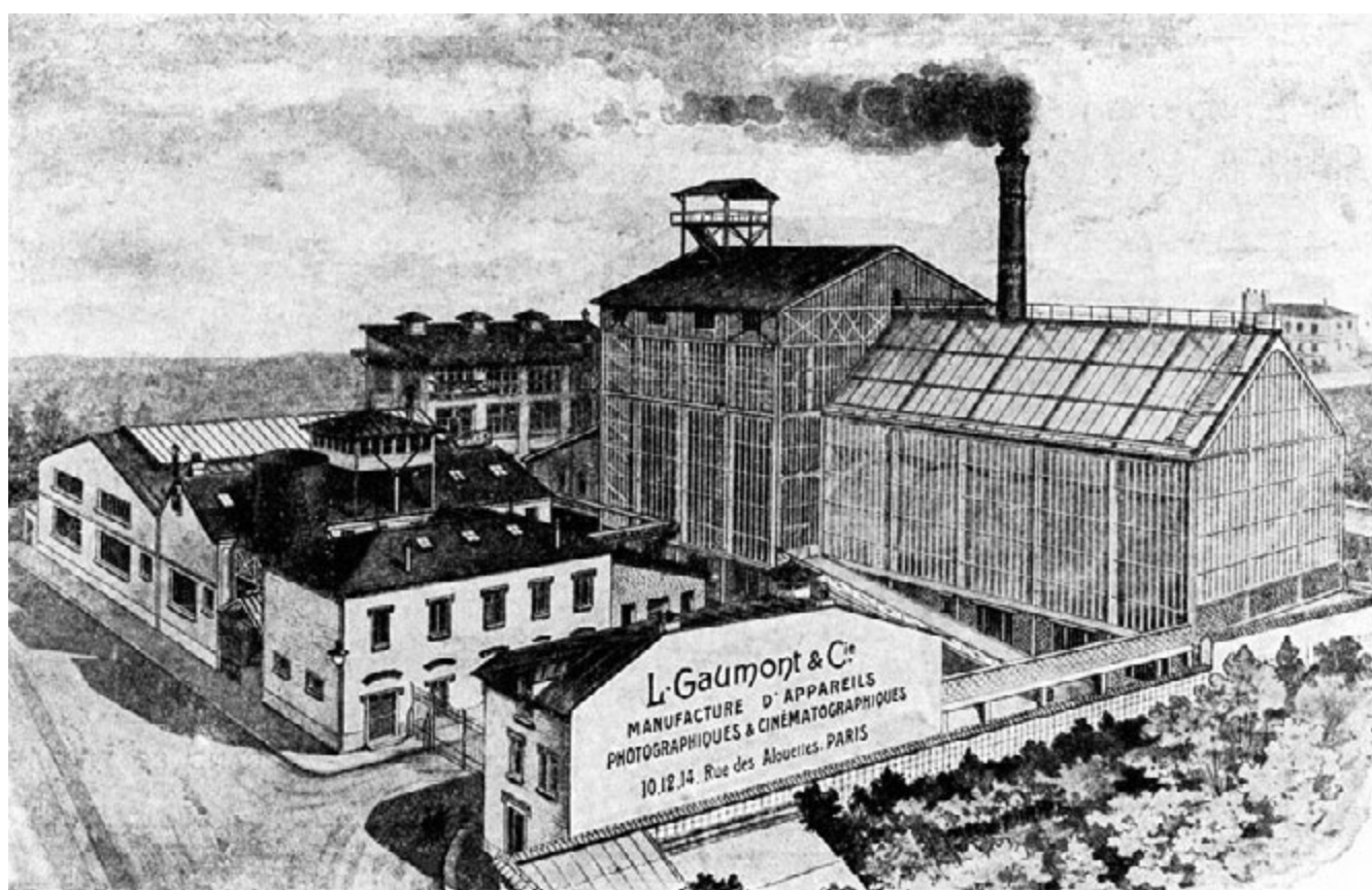
Studios Elgé (initiales de Léon Gaumont) aux Buttes Chaumont. Le premier atelier Gaumont de 1897 est au fond à gauche. La grande «serre» est le studio principal à éclairage naturel.

Avec Alice Guy le spectateur est invité à suivre le destin d'une femme artiste, qui sort des carcans réservés aux femmes dans la société, dans l'effervescence de ces années folles des premiers temps du cinéma !