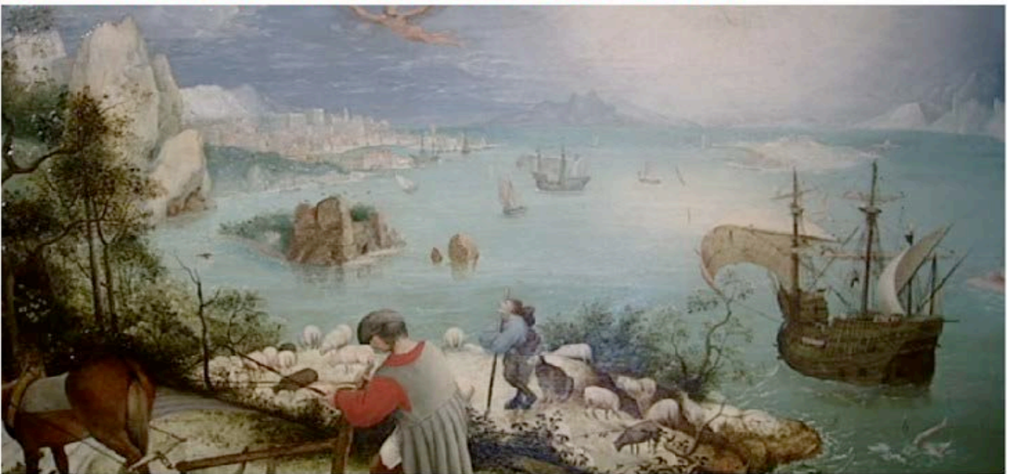
"La Chute d'Icare" de Bruegel

(Une image qui ne bouge pas te regarde autrement qu'une image en mouvement)