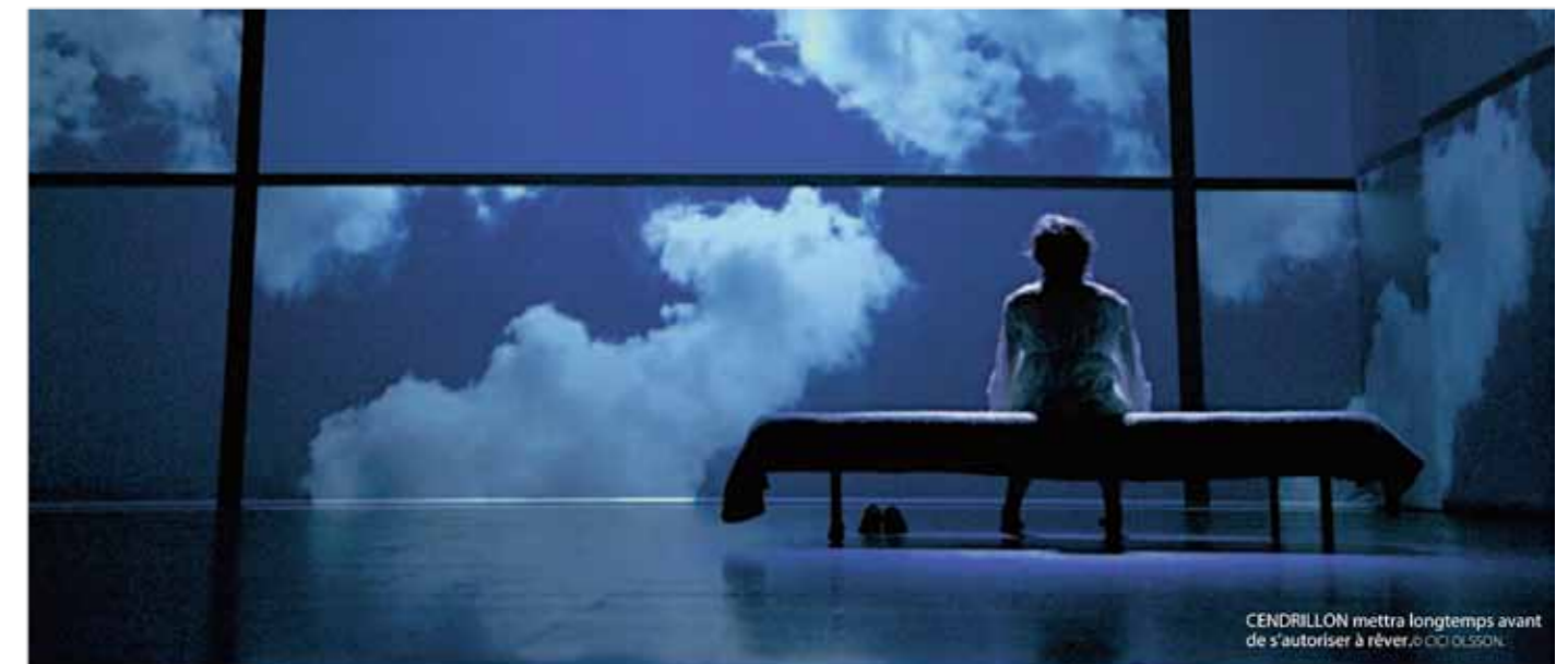
CENDRILLON mettra longtemps avant de s'autoriser à rêver. © G. OLSSON