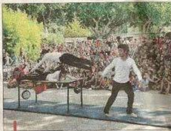
Les jardins de la mairie étaient noirs de monde.