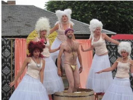
■ Spectacle déjanté pour le café éphémère samedi dernier dans la cour de la mairie.