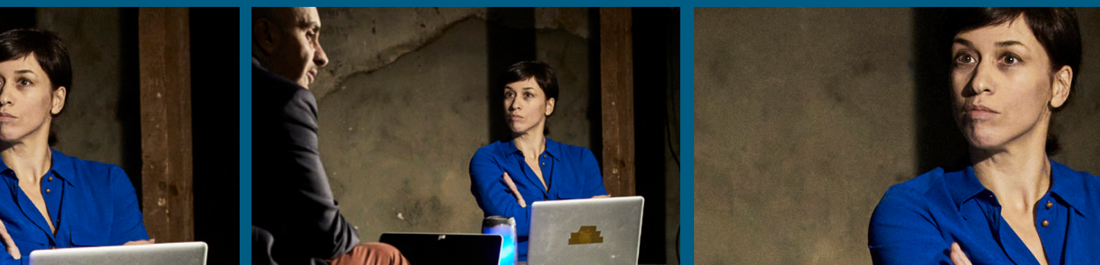
Notre histoire