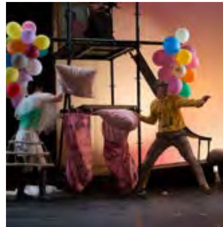
Qui rira verra de Nathalie Papin