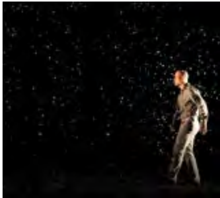
Ailleurs et maintenant de Toshiki Okada