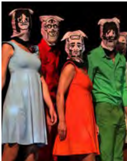
Cinq jours en mars de Toshiki Okada