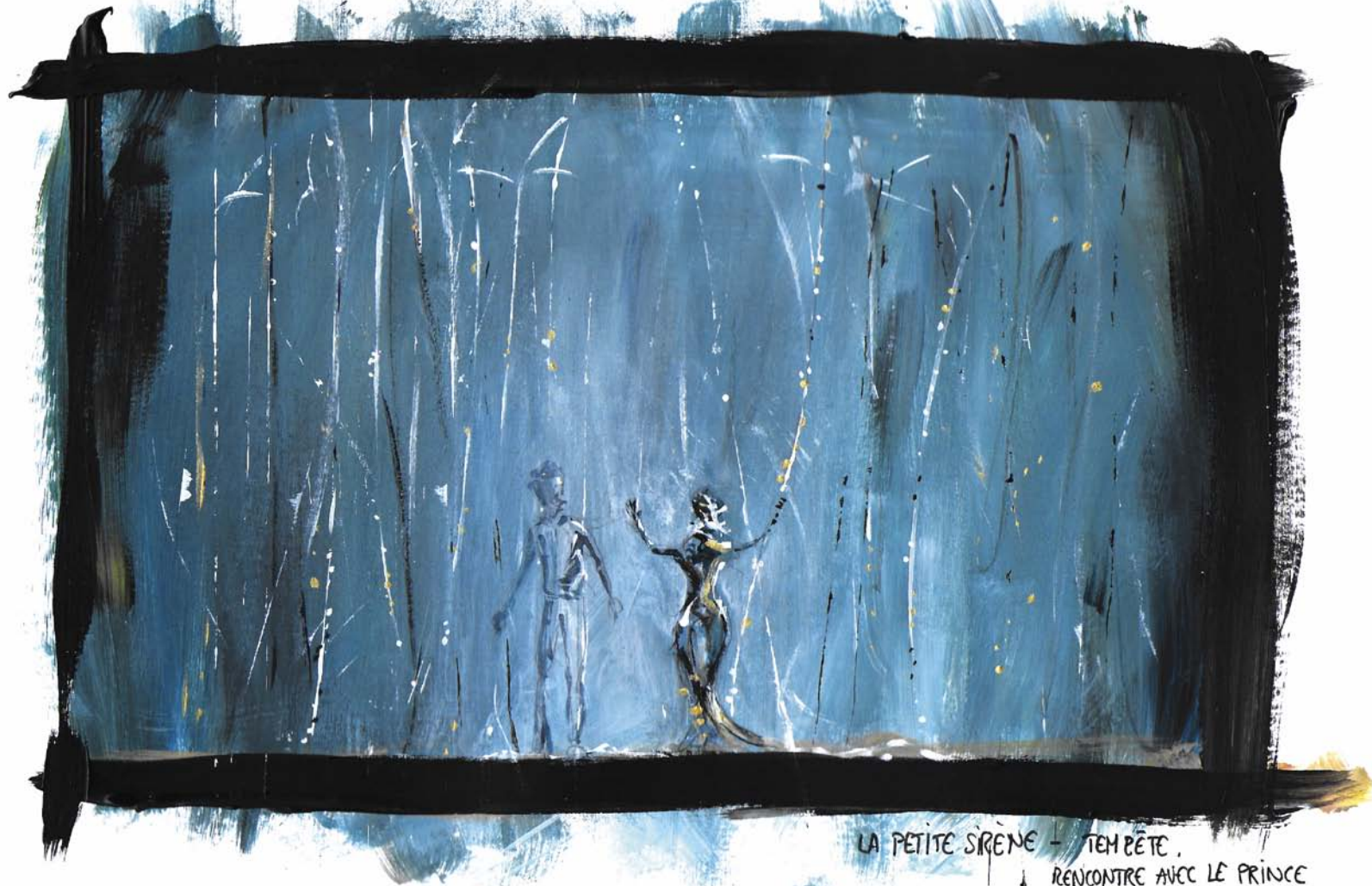
LA PETITE SIRENE - TEM PÊTE, RENCONTRE AVEC LE PRINCE