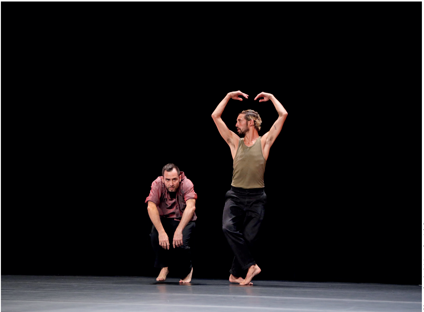
Photo de répétition