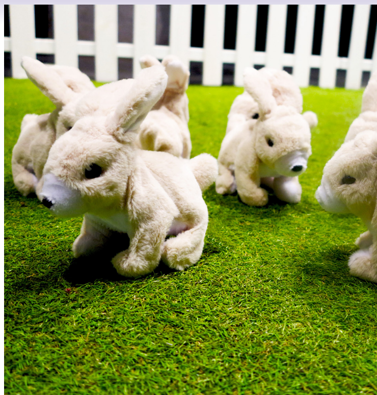
© Vertical Détour // Le problème lapin, Cartographie 7