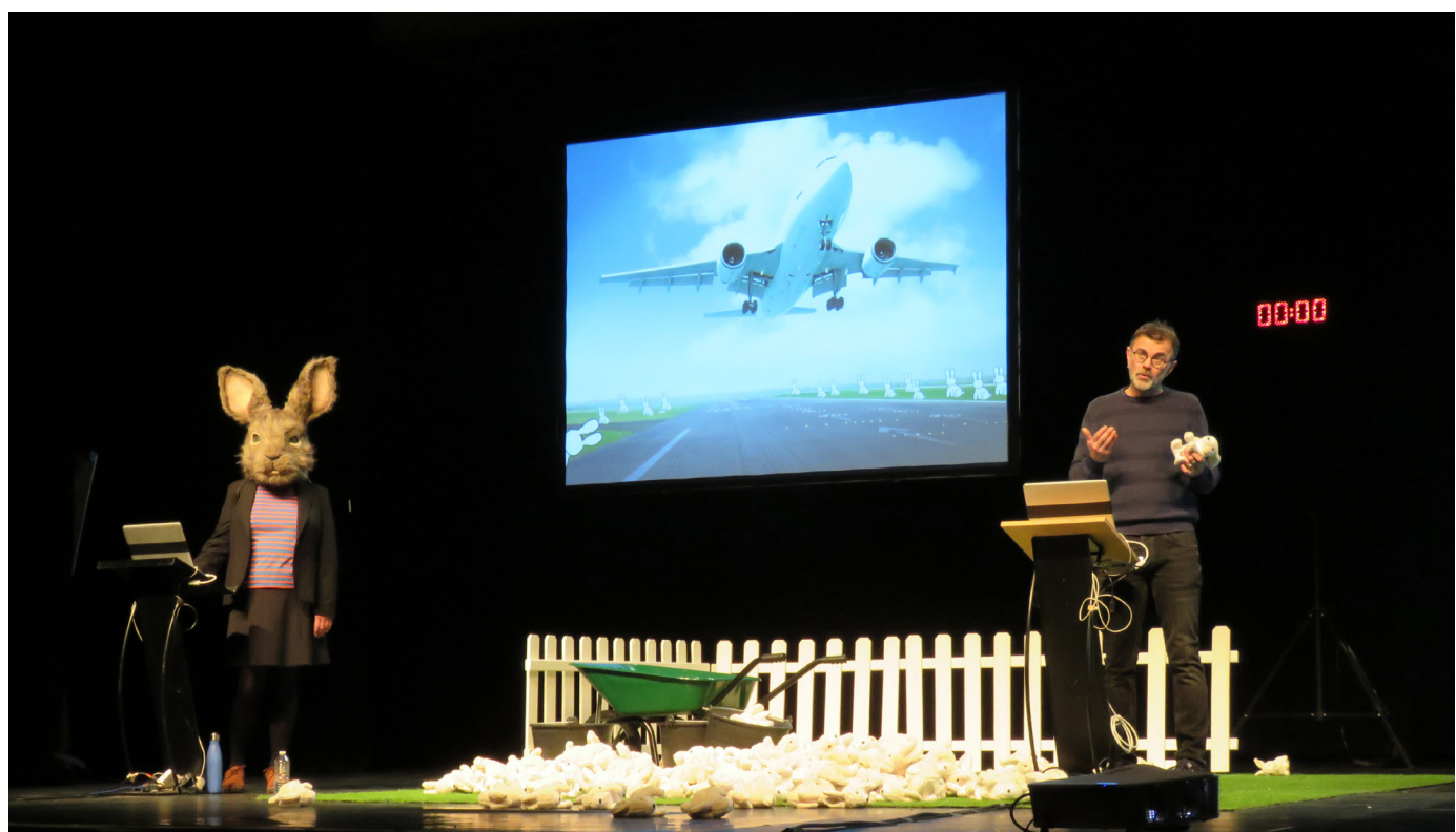
© Vertical Détour // Le problème lapin, Cartographie 7