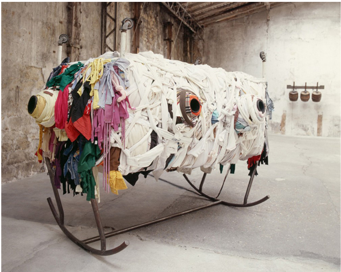
Chen Zhen, Berceau